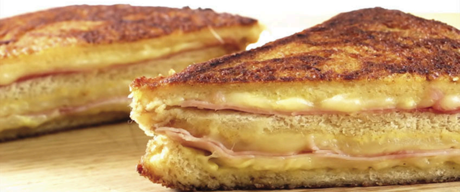
2347 - Monte Cristo