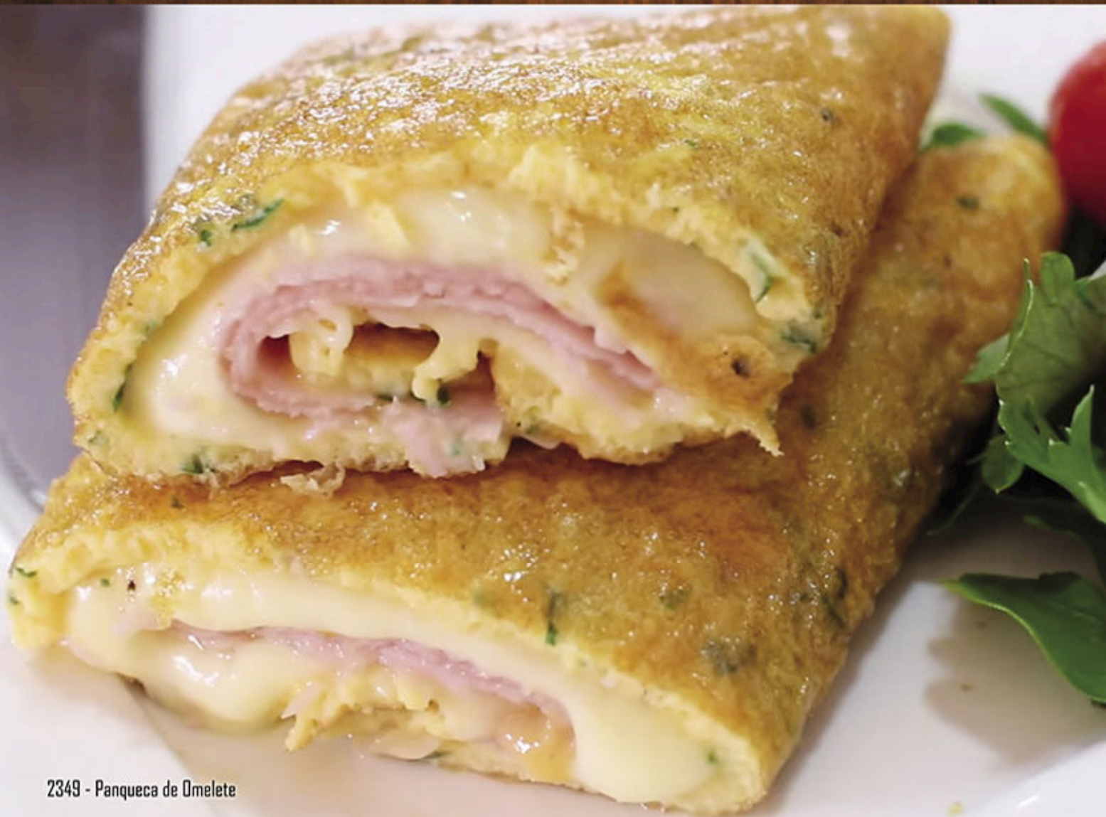
2349 - Panqueca de Omelete