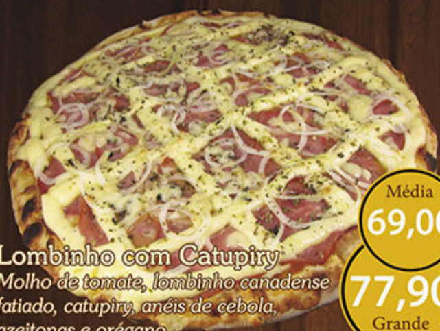
Lombinho com Catupiry Molho de tomate, lombinho canadense fatiado, catupiry, anéis de cebola, azeitonas e orégano.

Disponível de Segunda à Sábado a partir das 17 horas