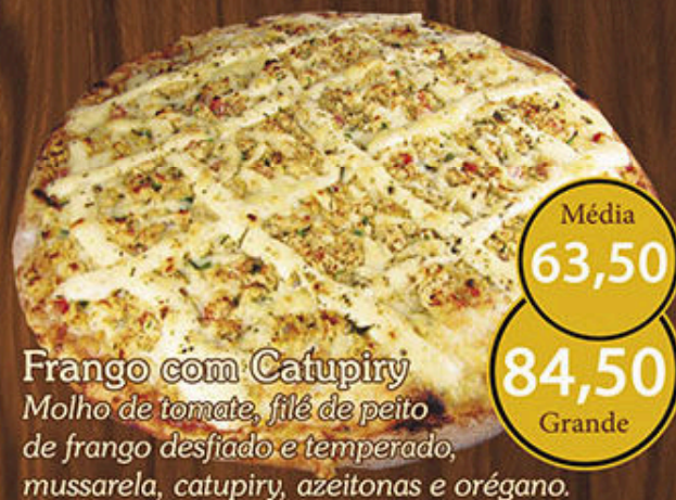
Frango com Catupiry Molho de tomate, filé de peito de frango desfiado e temperado, mussarela, catupiry, azeitonas e orégano.