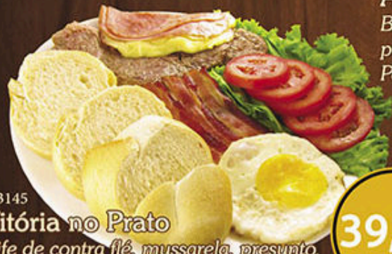
C:3145 Vitória no Prato

Bife de contra filé, mussarela, presunto, bacon, ovo, tomate e alface. Peso 200g