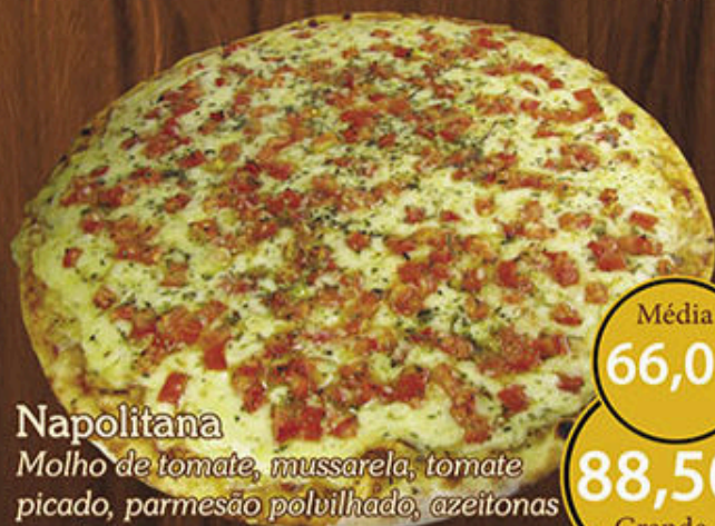
Napolitana Molho de tomate, mussarela, tomate picado, parmesão polvilhado, azeitonas e orégano.