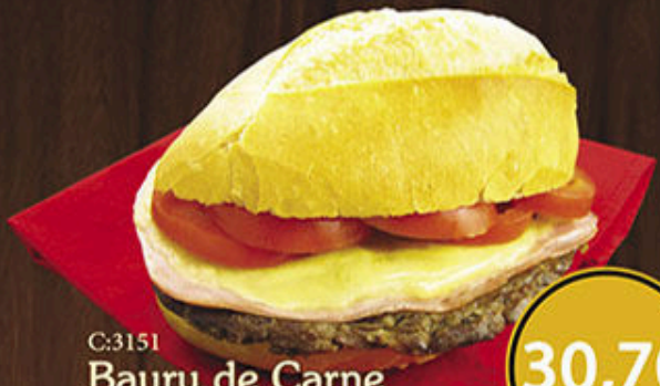
C:3151 Bauru de Carne

Bife de contra filé, mussarela, presunto e tomate. Peso 160g