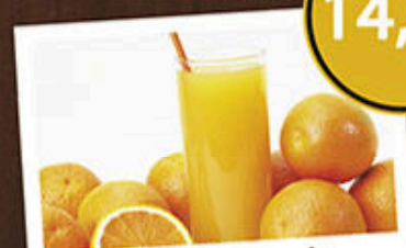
Suco Laranja (300ml) 14,50