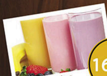
Vitamina Batida com Leite 16,90