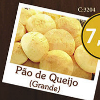
Pão de Queijo (Grande) 7,90