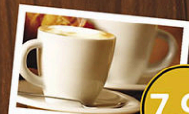
Café Expresso 7,90