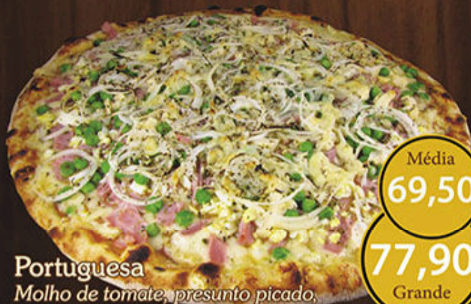
Portuguesa Molho de tomate, presunto picado, ovos cozidos e picados, anéis de cebola, mussarela, ervilhas, azeitona e orégano.