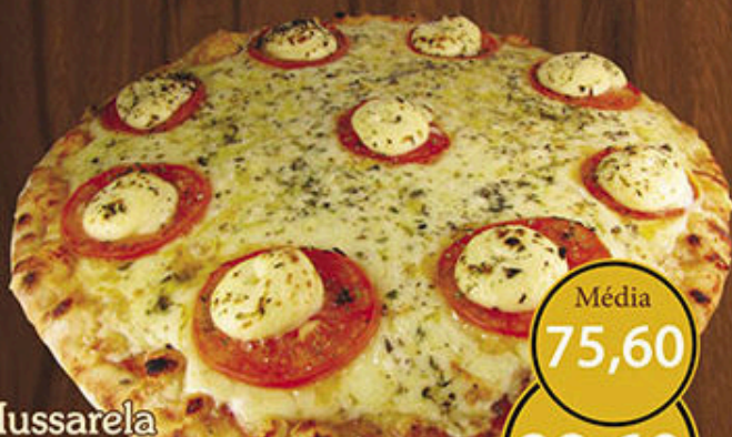
Mussarela Molho de tomate, mussarela, rodelas de tomate, azeitonas e orégano.