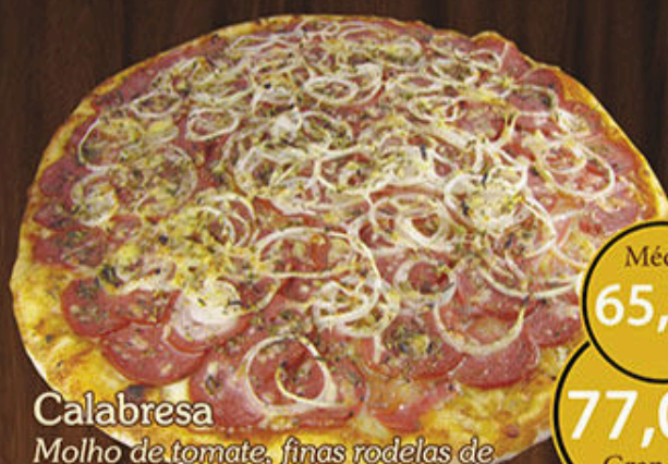
Calabresa Molho de tomate, finas rodelas de calabresa, anéis de cebola, parmesão polvilhado, azeitonas e orégano.